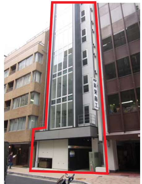
2011年竣工の新築です