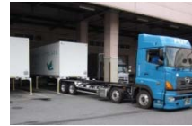
④エアサスを下げて分離する