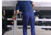
②エアサスを上げてアウトリガーを設置する