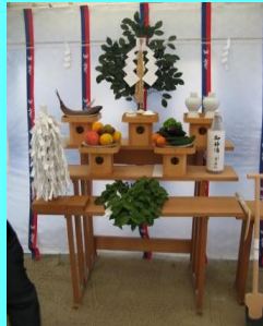
泉佐野の春日神社宮司様に御祈禱していただきました